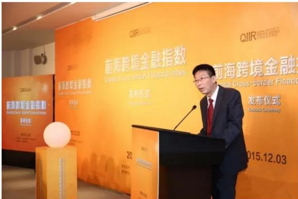
前海管理局副局长何子军致辞

12月3日，深圳市前海创新研究院与香港大学在前海合作区内共同举办前海跨境金融指数发布仪式，前海管理局副局长何子军、前海创新研究院院长陈坤耀教授、香港大学经济与工商管理学院副院长（金融创新和风险管理研究中心主任）林晨教授等单位和社会组织的嘉宾参加了发布仪式。